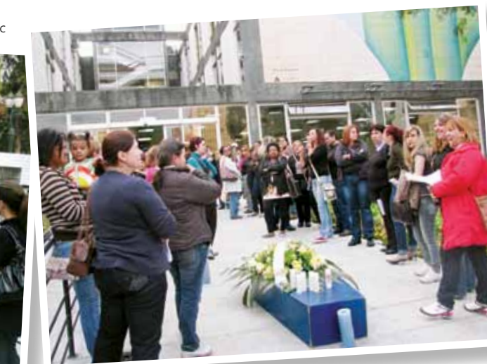
Com caixão e velas, servidores fizeram o "velório simbólico" da proposta de novo regulamento para o ICS